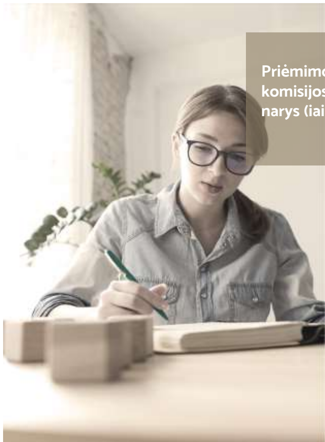
Priėmimo komisijos narys (iai)