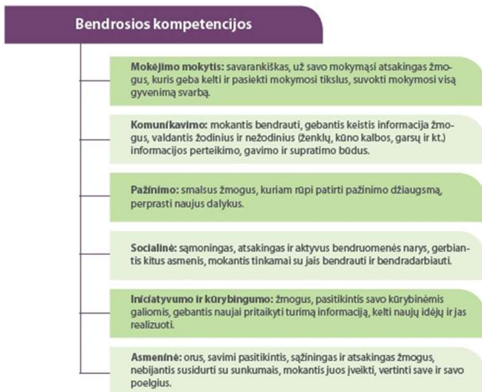
1 pav. Bendrosios kompetencijos 2

programose, pavyzdžiui, bendrojo lavinimo ir universitetinių studijų, kompetencijos yra skiriamos į dvi grupes: bendrąsias ir dalykines. Dalykinės yra susijusios su konkrečiu dalyku arba specialybės sritimi, o bendrosios yra visos kitos, kurios padeda gyventi visuomenėje, kurti ir palaikyti tarpusavio santykius, prisidėti prie bendrabūvio kūrimo, asmeninio tobulėjimo ir nuolatinio augimo. Pavyzdžiui, bendrojo ugdymo programose išskirtos šios bendrosios kompetencijos: mokėjimo mokytis, komunikavimo, pažinimo, socialinė, iniciatyvumo ir kūrybingumo bei asmeninė, 1 paveiksle pateikti šių kompetencijų aprašymai: